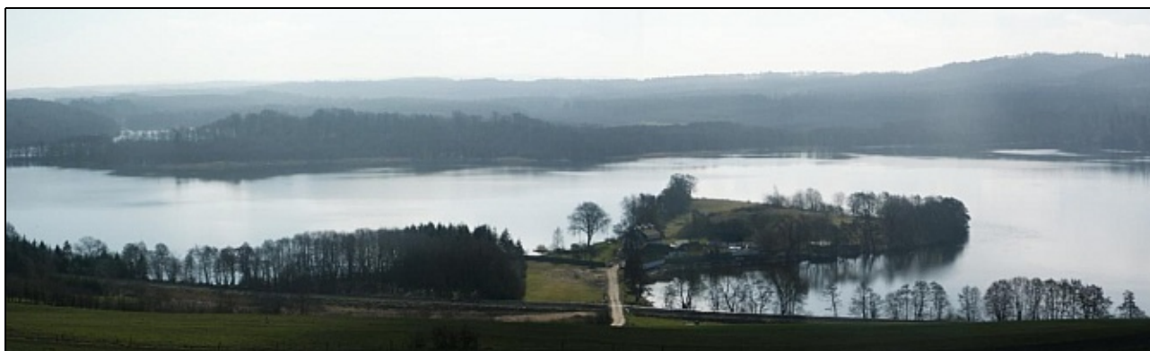
Julsø mellem Himmelbjerget og Laven set fra voldstedet Gammelkol, Laven. I forgrunden Dynæs.