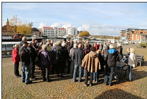
Havnen ved foden af Århusbakken

I et strålende vejr mødtes ca. 70 interesserede i Iskælderdaalen. Første punkt for turen var Århusbakken, hvor de fik at vide hvordan prøjserne den 24. april 1864 klokken 4 om eftermiddagen pludselig dukkede