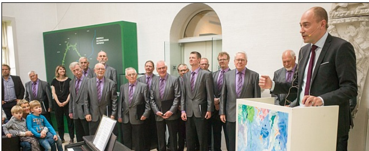
Åbning af udstillingen Undervejs m. Silkeborg Mandskor og trafikminister Heunicke.