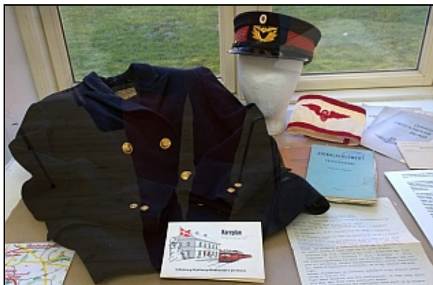
Gave fra tidl stationsmester Lysbro station