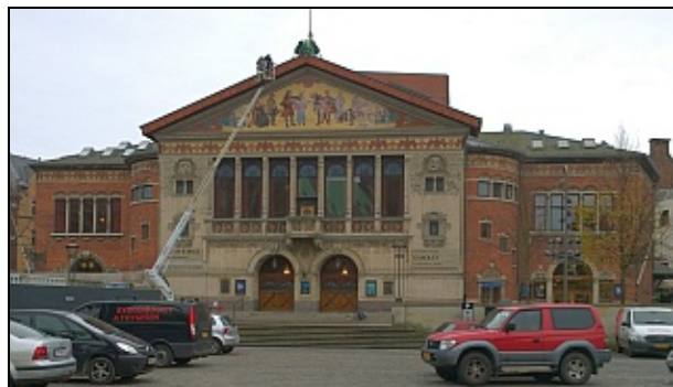
Århus Teater (m vinduespudser)