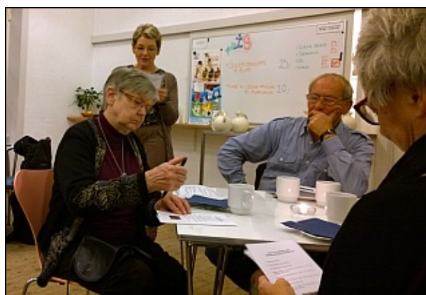
Frivilligmøde 13 nov 2014

Efter velkomst af Preben Strange og præsentation af koordinatore og grupper gennemgik Grete Juhler en folder udarbejdet om forhold mv for de frivillige.