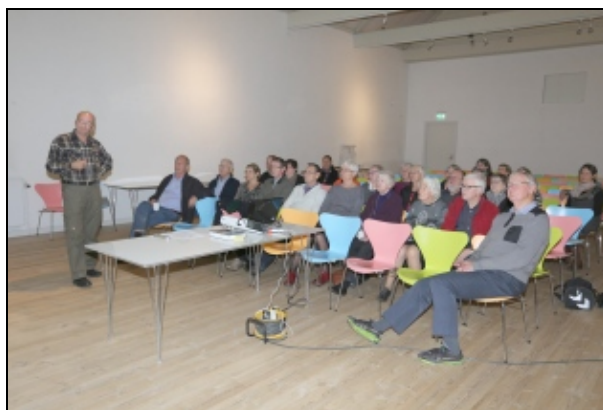
Frivilligmøde 13 nov 2014

Efter en kaffepause fortalte Preben Strange om lokale soldater-skæbner efter krigen i 1864, og der var en rundvisning i museets udstilling om krigen.