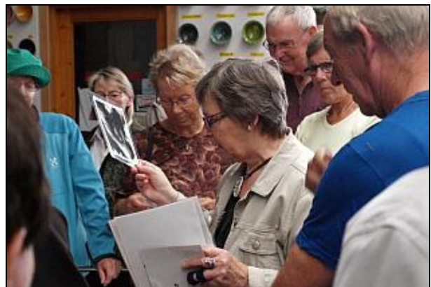
Tut, Sorring Lervarefabrik

erhverv(håndværk og detailhandel), men som i alle andre mindre byer er de lukket en efter en.