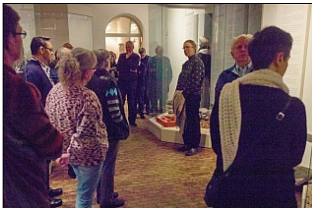
Frivilligmøde 5 feb 2015

"Hvordan er det kommet så vidt" om Theodora Lang og hendes virke. Udgangspunktet var kvindelige "fyrtårne" i Silkeborg, og at det i år er 100 år siden kvinderne fik valgret.