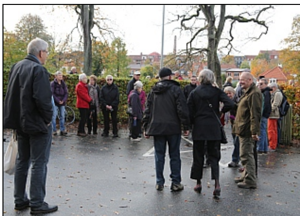
P-pladsen Iskælderdaalen

op på bakken og meget forsigtig indtog byen.