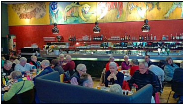
Cafe Hack

Efter fortælling og oplevelser på Strandvejen, kørte vi ind af de små gader helt ind bag Aarhus Teater, hvorfra vi gik til Café Hack for at indtage den ventende frokost. Og hvilken frokost, det var meget fornemt!