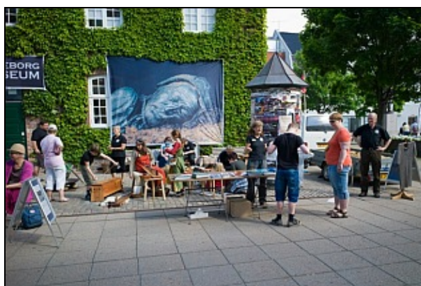
PR-arrangement Torvet 2013

Der bliver ikke PR arrangement på Torvet i år. Medlemsforeningens bestyrelse har besluttet at starte forberedelserne tidligere og udarbejde en handleplan/hvidbog i forbindelse med arrangementet.