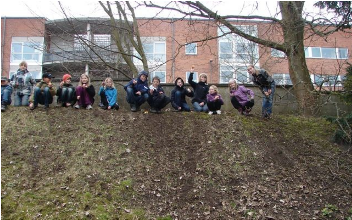
Her trilles med påskeharens æg!