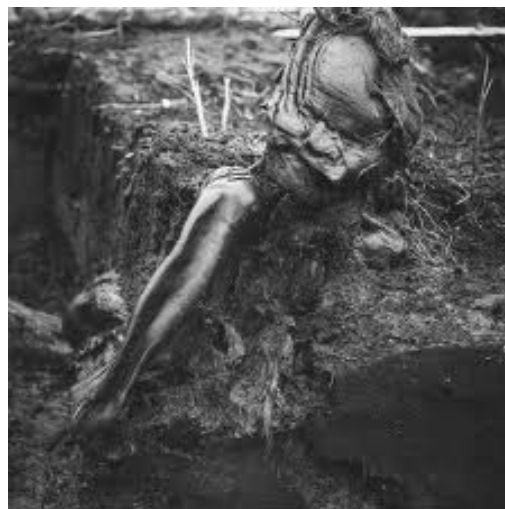
Grauballemanden dukker frem i mosen

Efter ekspeditionen til Ravnereden går vandreturen til Nebelgårds Mose, hvor Grauballemanden blev fundet i 1952 under tørvegravning. Ved mosen får I hele historien om Grauballemanden!!