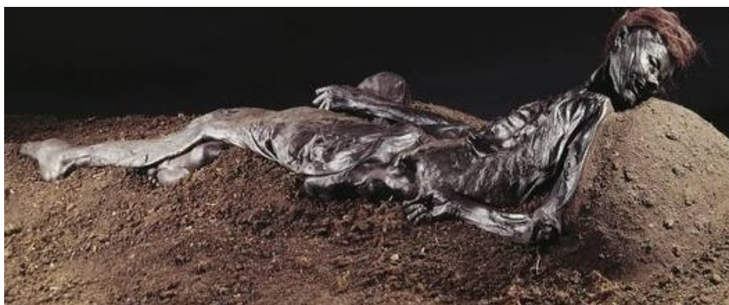
Grauballemanden er i dag udstillet på Moesgård Museum