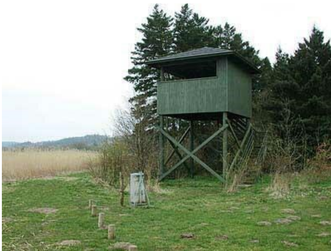
Fugletårnet ved Sminge Sø

Undervejs fortælles historier om Gudenåen, sagnet om hvordan den opstod, brugtes som transportvej, pramdragerlivet, stenalderbopladser langs åen og søen.