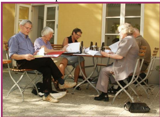
Redaktionsmøde i Informationsgruppen