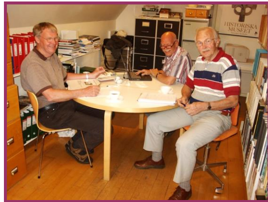
IT-gruppen i arbejde

Selv om gruppen selv har mange forslag til, hvordan hjemmesiden kan forbedres og gøres mere spændende for brugerne, er man også meget interesseret i at få forslag både til indhold og udseende fra andre.