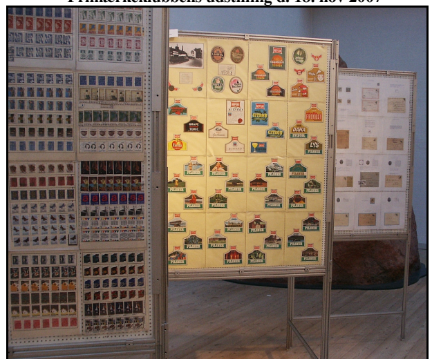
Frimærkeklubbens udstilling d. 18. nov 2007