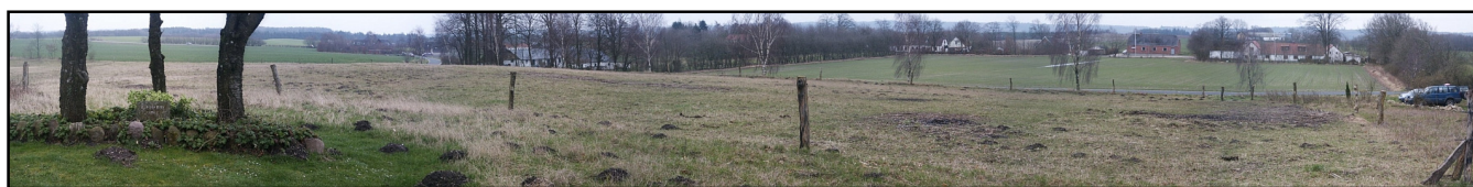
Panoramabillede over del af Tømmerby kirkegård. Mindesten for kirken ses til venstre mellem træerne.