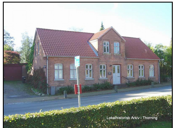
Lokalhistorisk Arkiv i Thorning

Blicheregnens Museum består af både museum og lokalhistorisk arkiv for den tidligere Kjellerup kommune. Museumsdelen har to frivillige, som hjælper med at foretage registreringerne af museumsgenstande i museernes databasesystem Regin. Arkivdelen har 7-8 frivillige, der stort set tager sig af driften af lokalhistorisk arkiv og holder det åbent for publikum.