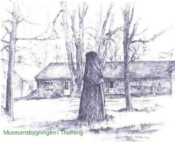
Museumsbygningen i Thorning