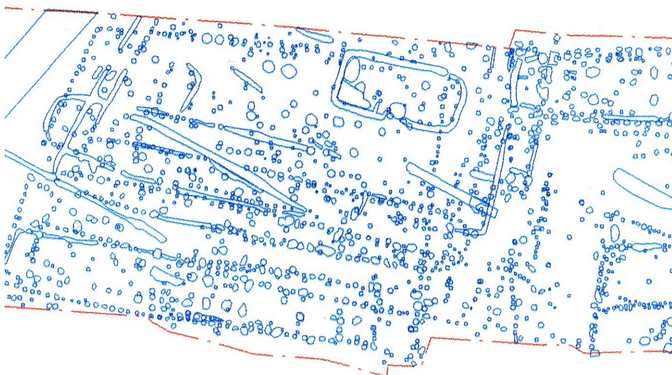
Detalje af kortudskriften som Kirsten Nalleman viser på side 10