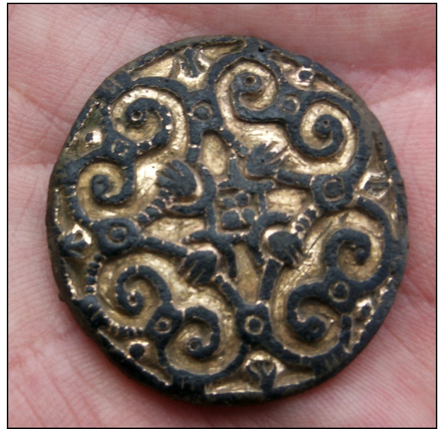
Dragtsmykket fra Hårup

Detektorafsøgningen sker med en indstilling af detektorerne, så metallet jern ignoreres, velvidende, at der måske kunne findes interessante jernfund på området. Det sker for at undgå at bruge en masse tid på at finde "bondejern", dvs den helt utrolig store mængde jernskrot, der ligger overalt på markerne (selv om man ikke ser det med det blotte øje). Det er jernstumper, søm, skruer bolte osv som er faldet af maskiner og redskaber på markarbejde, eller har ligget i gødning/gylle, der er kørt ud på markerne.