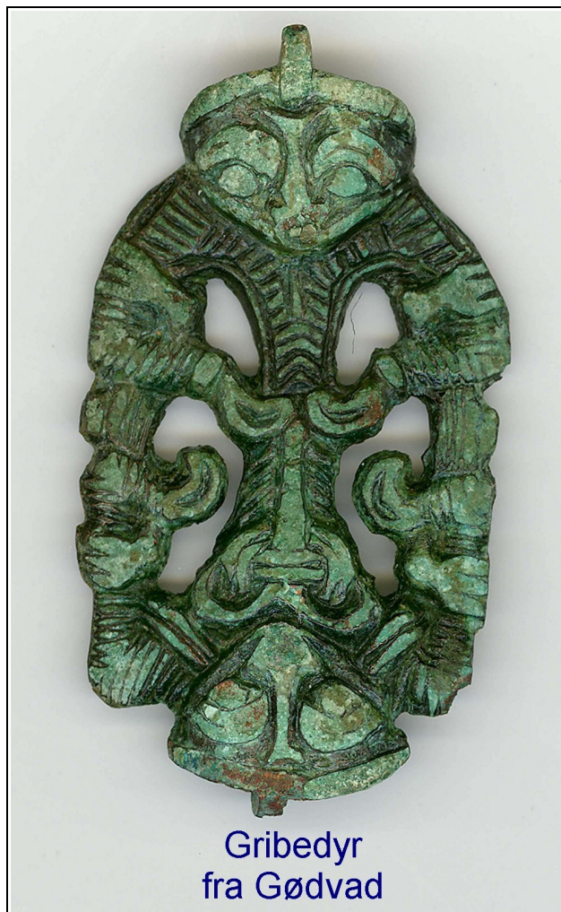
Gribedyr fra Gødvad

Første juni åbner sommerens nye udstilling, som har fået titlen: "Vikingerne i Gødvad". Der er fundet mange spændende ting under udgravningerne.