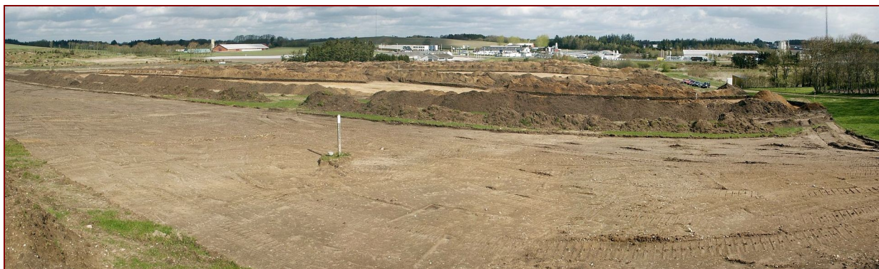
Panorama udgravningsområdet i Hårup