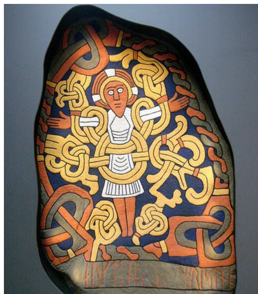
Jellingstenen, farvet