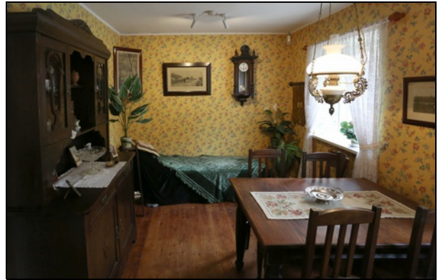
Stuen i arbejderboligen

De fastsatte kaffeselskaber er: søndagene 23/4, 21/5, 25/6, 16/7 – se forårets forårsprogram.