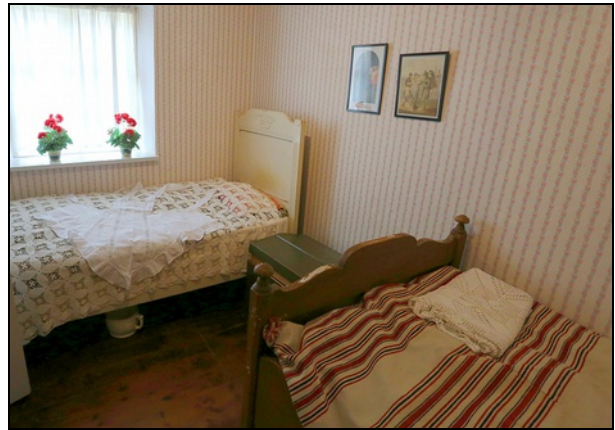
Arbejderbolig. Sovekammer .

For at undgå at gæsternes overtøj bliver lagt på sengen, som man ellers gjorde i gamle dage, forsøges det at finde en knagerække, som passer i stilen og tiden.