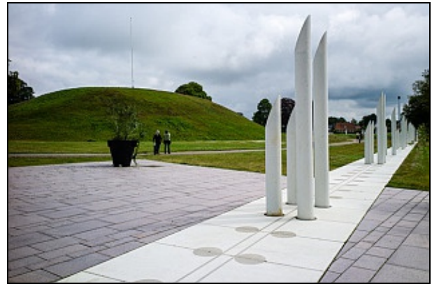
Kong Frederik den 7. Arkæologen J. J. A Worsaae begyndte de første udgravninger i Jelling, men siden der er det fortsat med nye udgravninger og fund. De seneste undersøgelser har afsløret anlæggets imponerende