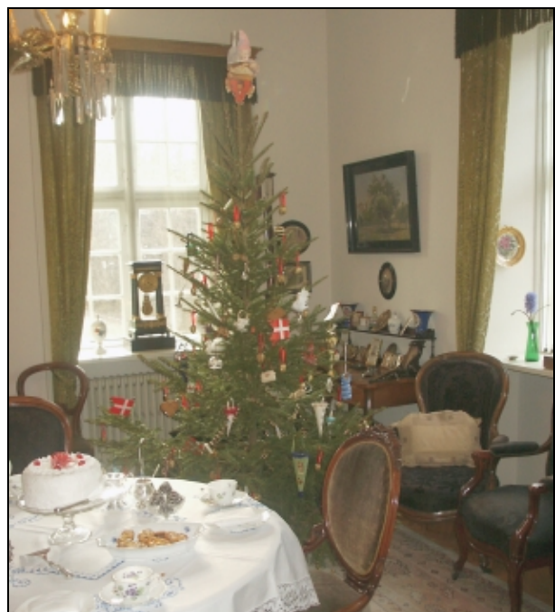
Juletræ museet 2006