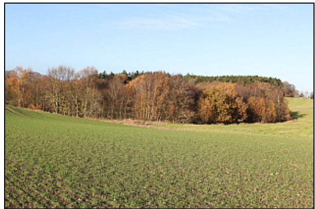
Grauballemandens mose i Nebel er omkranset af træer