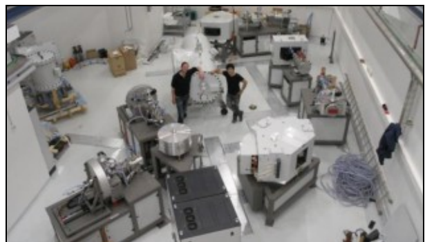
2013 fik Aarhus Univesitet for 17 mio kr. en ny atomaccelerator til bl.a. C14-datering

Teknikken til at fastslå indholdet af C14 er blevet meget forfinet. Oprindeligt målte man C14 indhold med Geigertæller på grundlag af den udsendte radioaktive stråling. Det betød at man skulle have en ret stor mængde organisk stof til rådighed til undersøgelsen, og dette stof blev tilintetgjort ved undersøgelsen. Nu anvendes en teknik, hvor man praktisk taget tæller C14 atomer, og der er kun brug for meget små mængder stof for at kunne foretage undersøgelsen. Hvor der før skulle bruges en hel lårbeknogle er det nu tilstrækkeligt med en lille boreprøve, 1/10.000 del i forhold til tidligere, og så er den nye teknik oven i købet langt mere præcis.