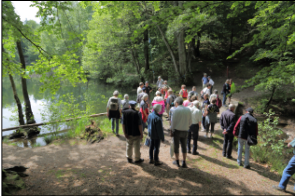
Millingsbæk ved Slåensø

Den 12. april 1920 kl. 6 om morgenen brød vandet igennem den dæmning, der lå oven for fabrikken og som tjente til at opstemme vandet i en højde af ca. 4 meter. Over dæmningen førte skovvejen via en stenkiste. På mindre end 10 minutter var store dele af dæmningen vest for broen skyllet væk, og broen styrtet ned.