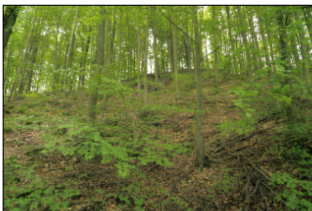
I denne bakketop er spor efter brunkulsgravningen