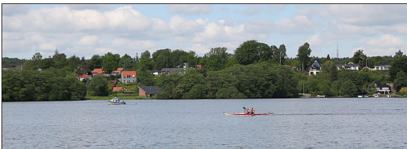
Udsigt over Borresø fra Millingbækkens udløb