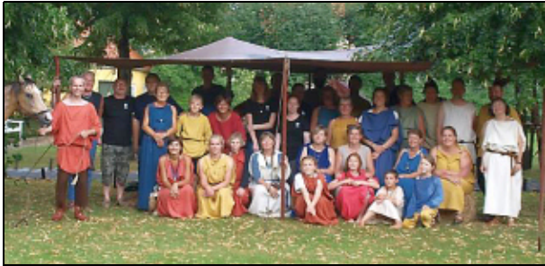
Jernaldermarked 2014.