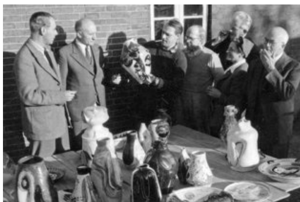
Sorring Lervarefabrik, Jørn m fl.

Lørdag den 20. september kl. 14.00 mødes vi ved Sorring lervarefabrik, hvor Tut fortæller og viser rundt i byen, og om hvad der skete hvor i de sidste 100 år. Hun fortæller blandt andet om sin barndom på lervarefabrikken og om sin far. Den unge generation fortæller om lervarefabrikken nu, og vi drikker medbragt kaffe der.