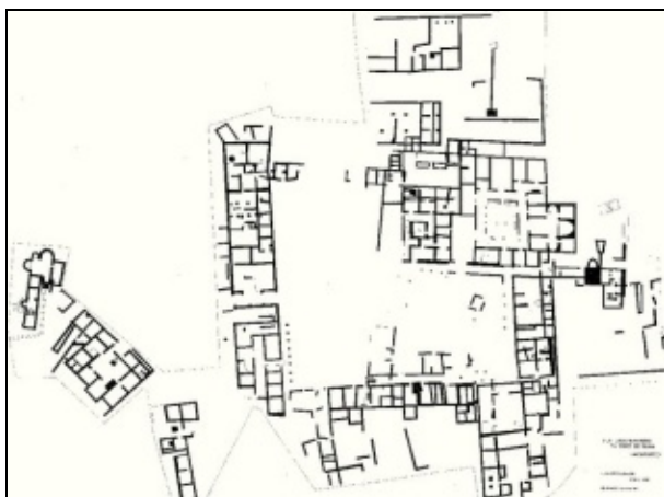
Oversigt over Torre de Palma

For det ældste romerske bygningskompleks på den Iberiske halvø, Torre de Palma i Portugal, har mørteldateringen kunne vise en byggeperiode, der har strakt sig fra år 100 til 650 e.kr. og man har kunnet fastlægge kronologien i opførelsen af de enkelte dele af komplekset.