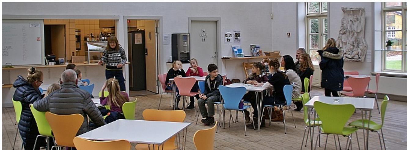
Hugin og Munin klubben