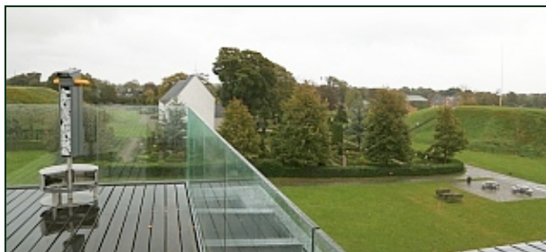
Mellem de to gravhøje ligger kirken. Udsigt fra tagterrassen. En "kikkert" står til venstre i billedet.

Fra tagterrassen oven på centerbygningen kan man få et overblik over, hvor stort det historiske område i Jellings storhedstid var med de to gravhøje, runestenene, kirken og den enorme skibssætning af sten, alt sammen omkranset af ca 1400 m palisadehegn.