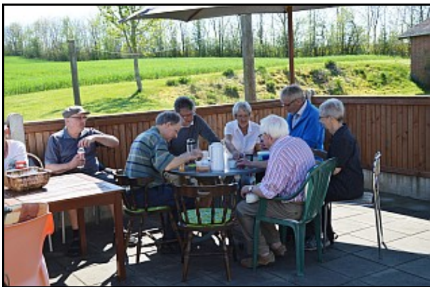
Udflugtsdeltagerne på Hylkjær dal