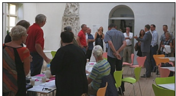
Fine gæster dukker op under koordinatormødet