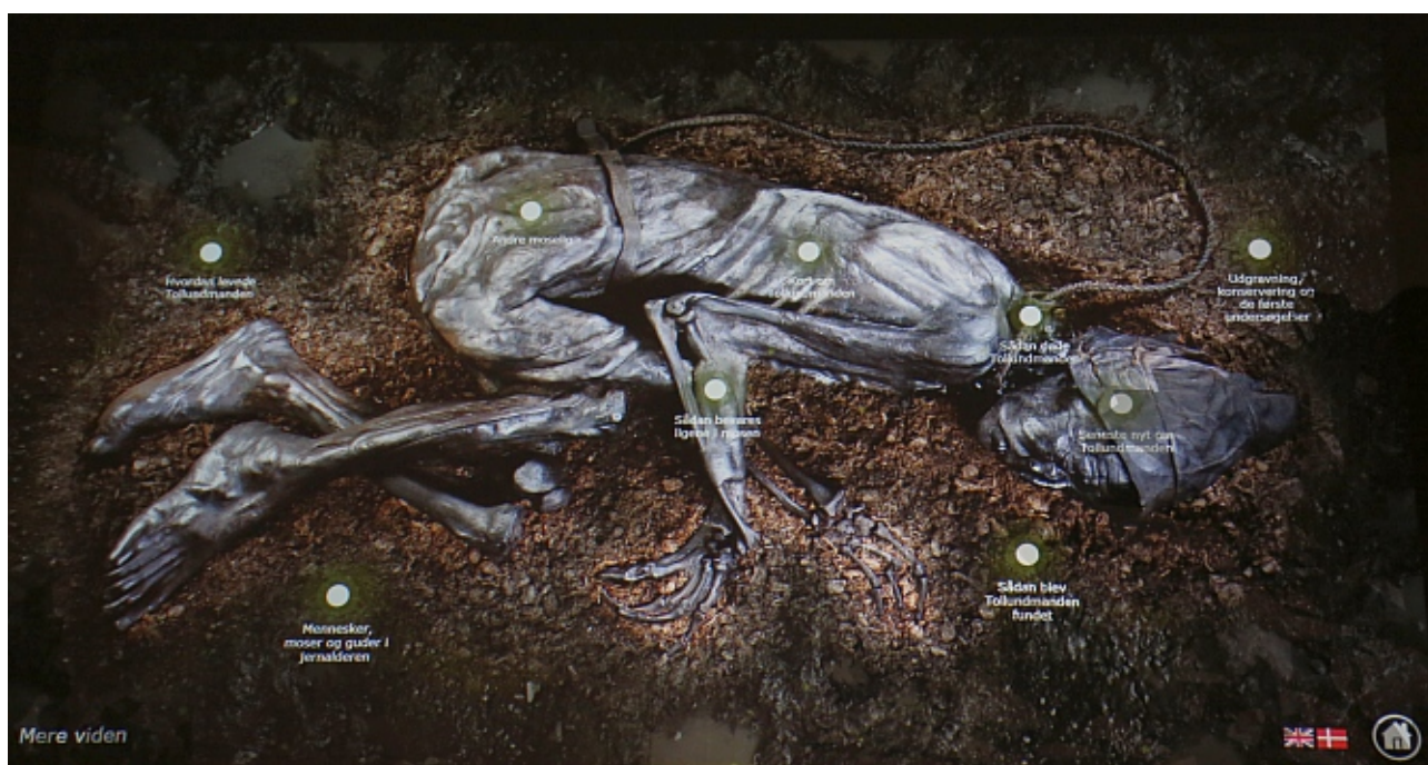
Den digitale platform