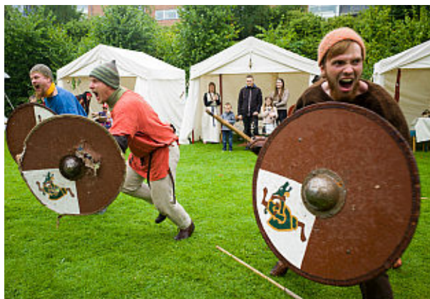
Jernaldermarked m. telte.

Stor ros til både museet og frivilliggruppen for at få gruppen på banen igen.