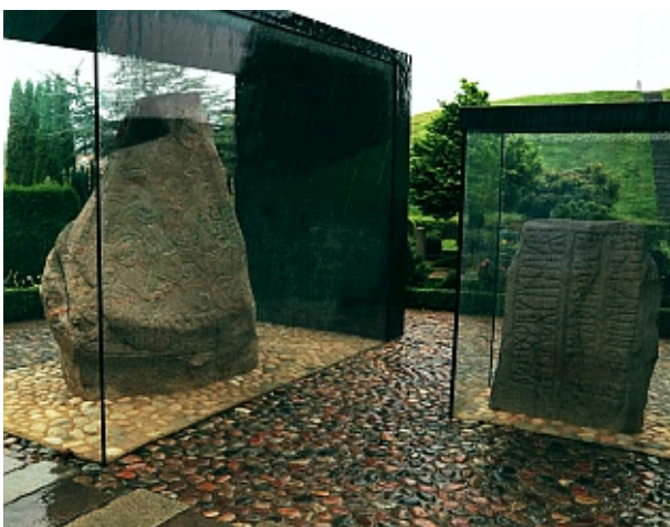
Runestenene er beskyttet mod klima og hærværk

Ved et besøg i "Oplevelsescenter Kongernes Jelling" skal man ikke regnes med at se en lang række fund fra vikingetiden. Der er faktisk ikke fundet ret mange genstande i Jelling.