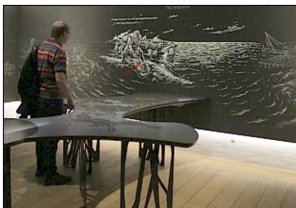
Et tryk på en knap udløser et blodigt øksehug..

Der er utvivlsomt nogen, der synes, der er for meget pop og flimrer. Efter min mening, er det en god måde at give en introduktion til historiske emner. Man får en kortfattet, illustrativ og letfattelig oplysning om samlingen af det danske rige, overgangen fra asatro til kristendom samt vikingetidens konger, -ikke mindst Gorm den Gamle, Thyra og Harald Blåtand.