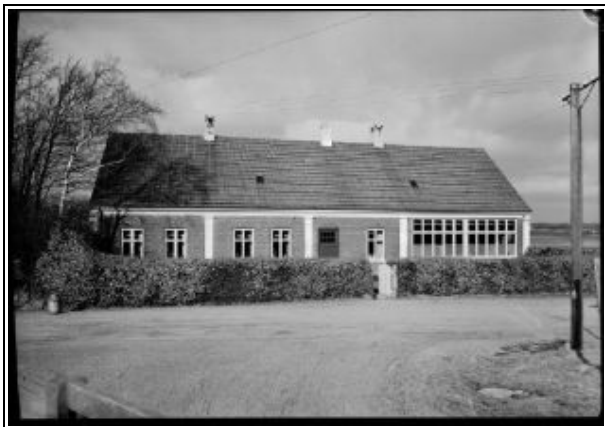
Øster Bording skole 1905-1964

Man skulle spare, og eleverne skulle hjælpe til. Der var 3 hold i bette klasse (3 timer eftermiddag) og 4 hold i stur klasse (3 timer formiddag)