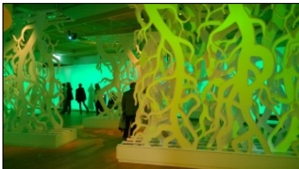
Ask Yggdrasil's rødder.

"Mytologi", hvor man i en kulisse af Yggdrasil's rødder kan høre forskellige fortællinger fra den nordiske mytologi.