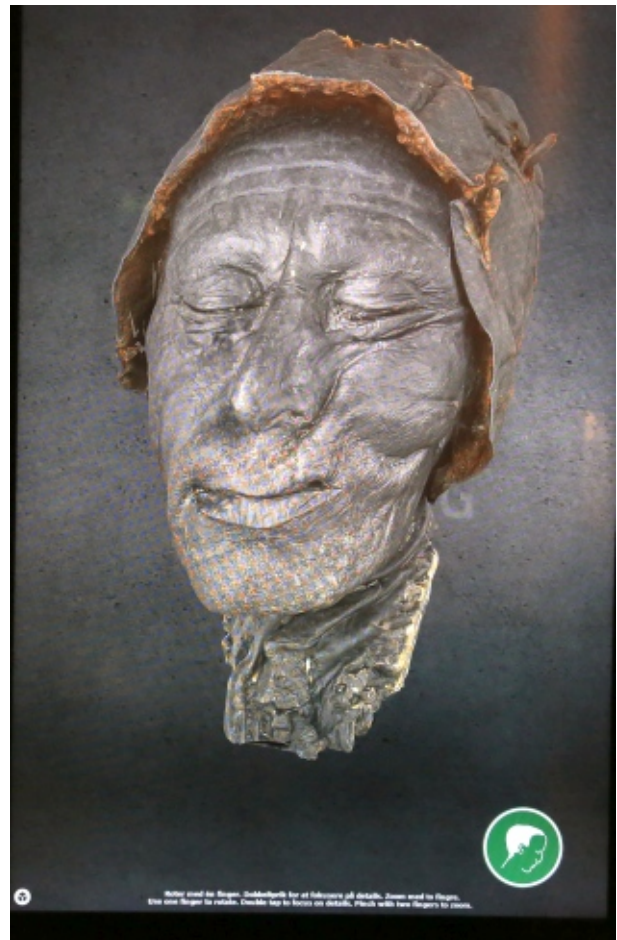
Interaktiv skærm. Foto: Jørn Froberg (NB ikke på billedet)

e) Ud for østvæggen mellem indgangene til Tollundmanden, placeres et digitalt arbejdsbord, ("touch-bord"), hvor forskellige aspekter vedr. Tollundmanden kan undersøges af museumsgæsterne. Undersøgelserne projekteres desuden op på østvæggen, så andre gæster kan følge med i processen. Desuden opsættes digital skærm, hvor andre aspekter af Tollundmanden belyses.