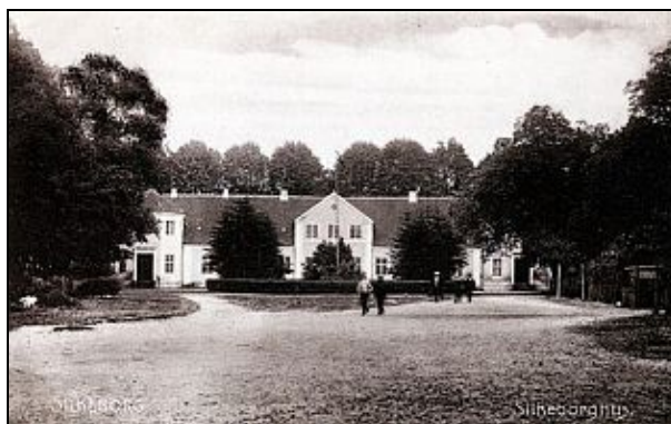
Hovedgården på gammelt postkort. Ukendt årstal.