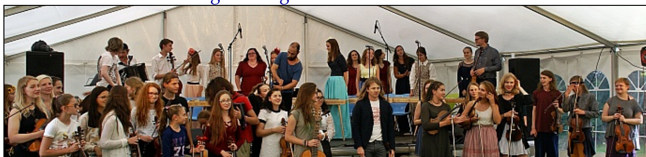
Folkemusik på Hovedgården 5. aug 2016.